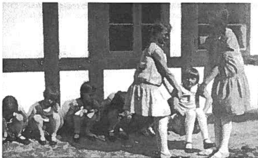
Børn, der leger "jydepotter".